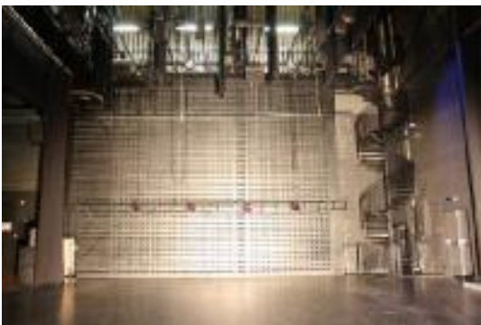
Coupe du plateau côté jardin

Au-delà de la dernière porteuse, à environ 10.50m, deux ponts triangulés (tête en bas) en poutre H40D de 15m d'ouverture avec une charge répartie de 250 kg répartis. Ceux-ci peuvent être déplacés en profondeur si la demande est effectuée suffisamment en avance.