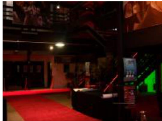
le hall et l'entrée public