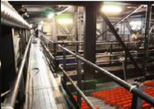
la passerelle jardin