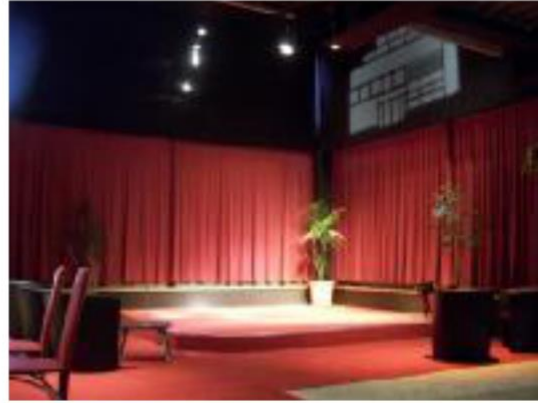
le plateau du hall