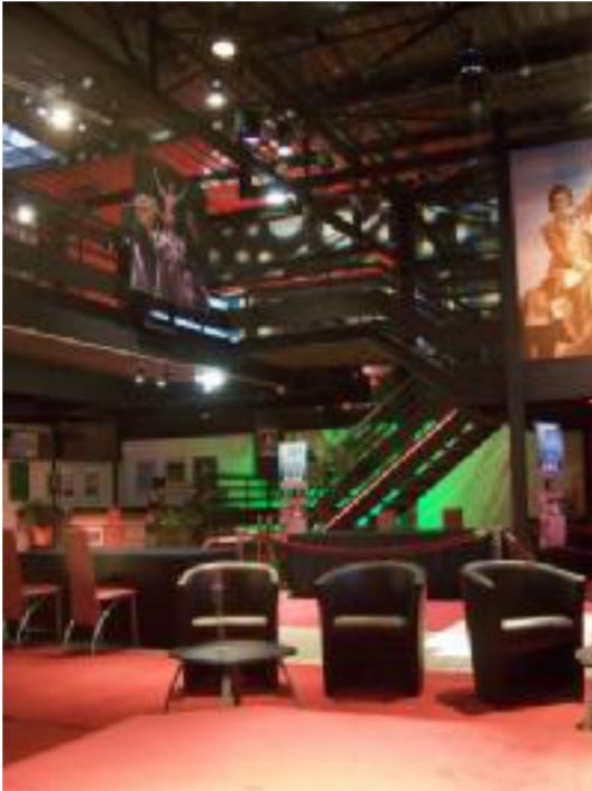
le hall d'accueil