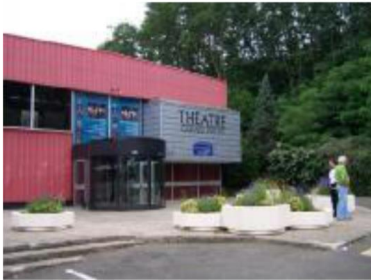
l'entrée du tgp