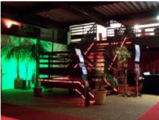
le hall d'accueil et l'accès mezanine