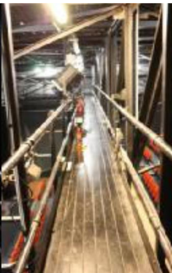
la passerelle face