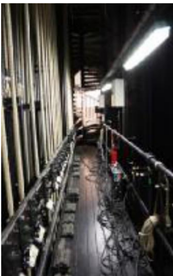
la passerelle commande