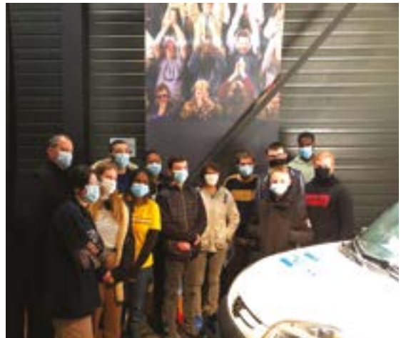
Les coulisses du Paris-Nice : Flocage de véhicules municipaux, ateliers dans les accueils de loisirs et écoles...