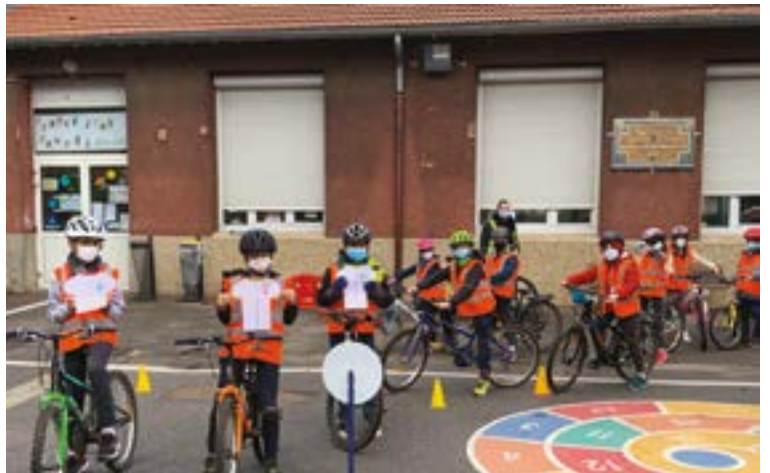
L'ensemble des Saint-Cyriens s'est investi pour accueillir la course cycliste le 7 mars prochain.