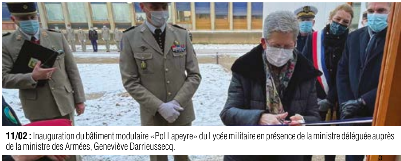
11/02 : Inauguration du bâtiment modulaire «Pol Lapeyre» du Lycée militaire en présence de la ministre déléguée auprès de la ministre des Armées, Geneviève Darrieussecq.