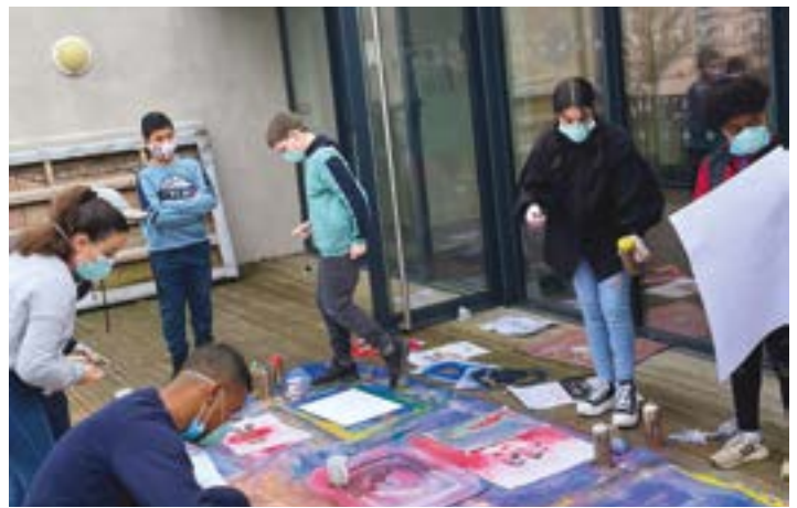
15/02 - 26/02 : Ateliers street-art, Casino, ateliers scientifiques... Retour en images sur les vacances d'hiver du Cyrado