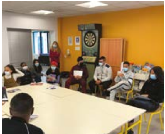
15 et 16/02 : Intervention d'un animateur pour sensibiliser les jeunes aux risques de l'alcoolisme et des addictions.