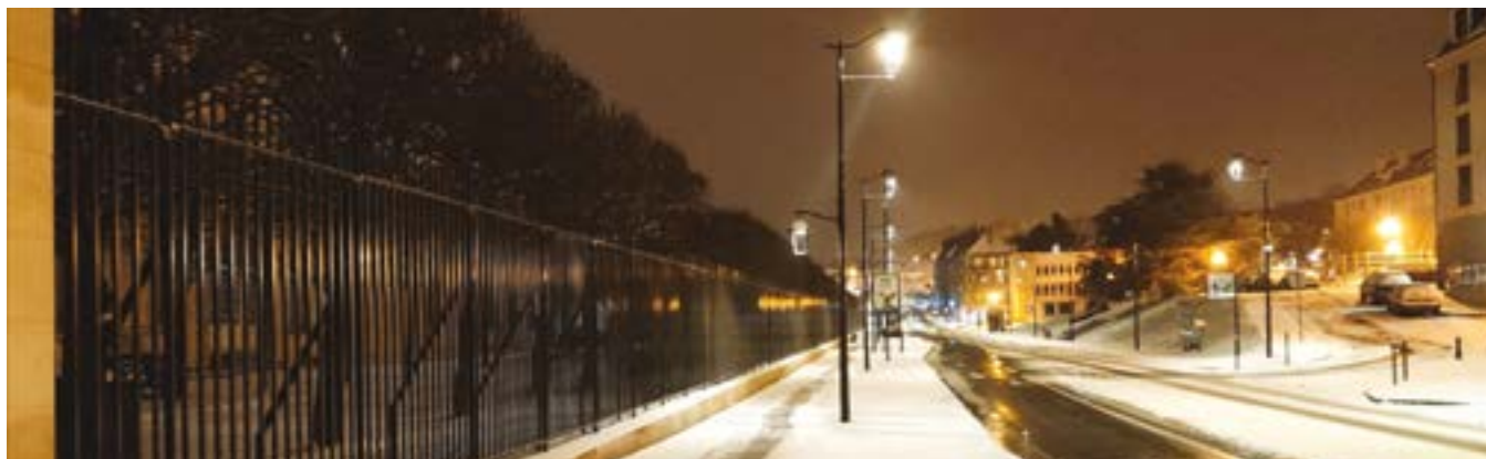
09/02 : La neige s'est de nouveau invitée à Saint-Cyr. L'occasion de prendre de jolies photos de notre ville, revêtue d'un manteau blanc.