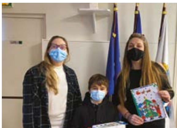
03/02 : Remise des récompenses aux jeunes et grands gagnants du concours de dessins de Noël.