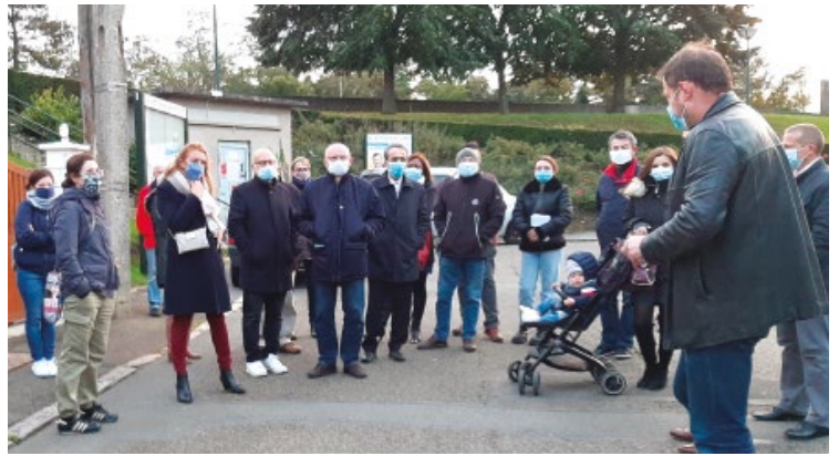
13/10 : Malgré le contexte, les Saint-Cyriens ont répondu positivement à l'invitation du maire aux balades urbaines d'automne.