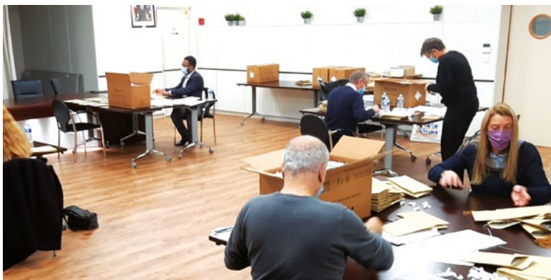
29/10 : Dès le lendemain des annonces du Président, l'équipe de la majorité municipale prépare les masques destinés aux 1216 élèves des écoles primaires de la ville.