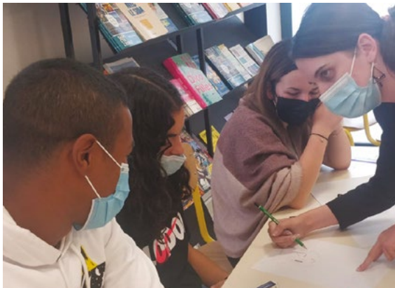
10/10 : Nouveau succès pour cette 4 e édition du festival Saint-Cyr Manga.