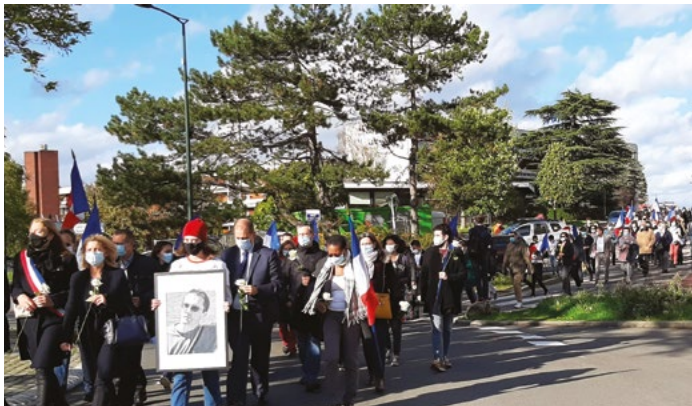
21/10 : Les Saint-Cyriens étaient réunis pour rendre un vibrant hommage à Samuel Paty.